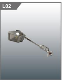
50W LED扁嘴射灯 50W LED Spade lamp