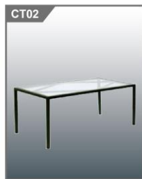
双人咖啡台 Coffee Table 1000L x 550W x 450H mm