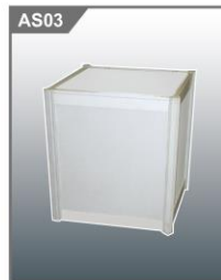
矮身展示台 Low Display Cube 500L x 500W x 500H mm