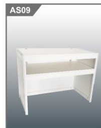
1M高咨询桌 Information Counter 1mH 1000L x 500W x 1000H mm