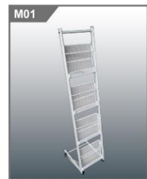
杂志架A Magazine Rack A 380 x 1500H mm