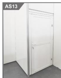
锁门 Lockable Door 950W x 2000H mm