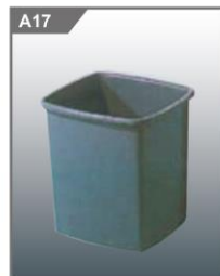
废物箱 Wastepaper Basket 250L x 170W x 290H mm