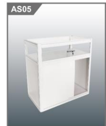
矮身玻璃柜 Low Glass Showcase 1000L x 500W x 1000H mm