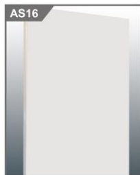
展板 Panel 1000W x 2500H mm