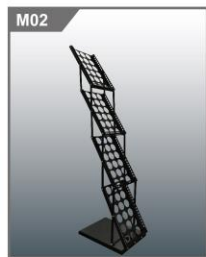
杂志架B Magazine Rack B 270 x 250 x 1200H mm