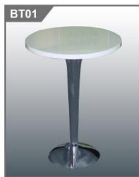
吧桌 Bar Table 600Φ x 1000H mm