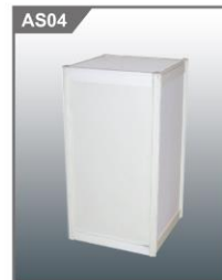
高身展示台 Tall Display Cube 500L x 500W x 1000H mm