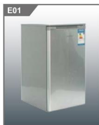
冰箱 Refrigerator(90L) 500L x 500W x 860H mm