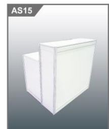
阶梯型咨询桌 Infomation Counter 1030L x 535W x 1100H mm