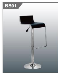
吧椅 Bar Stool 460W x 400D x 455H mm