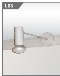
9W LED长臂射灯 9W LED Long Arm spotlight