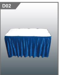
签到桌(蓝色围裙) Registration Table(blue cover) 1200L x 450W x 750H mm