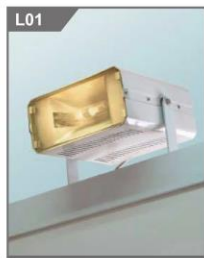
150W金卤灯 150W HQI floodlight