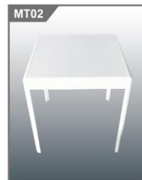
方台 Square Table 650L x 650W x 700H mm