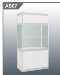
高身玻璃柜 Tall Glass Showcase 1000L x 500W x 2000H mm