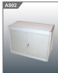
锁柜 Lockable Cupboard 1000L x 500W x 750H mm