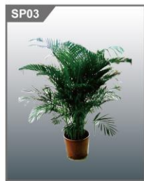
植物 Plant 1000H mm