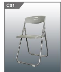
折椅 Folding Chair 460L x 400D x 455H mm