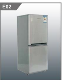
双门冰箱 Refrigerator(140L) 500W x 500mm x 1350H mm