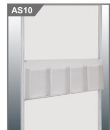
资料架 Catalogue Holder (metal) 950L x 50D x 280H mm