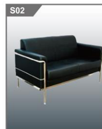
双人沙发 2-seat Sofa 1500W x 700D x 450H mm