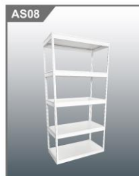
货架 Cargo Rack 1000L x 500W x 2000H mm