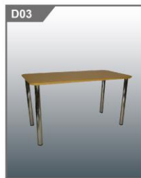
会议桌 Meeting Table 1400L x 700W x 750H mm