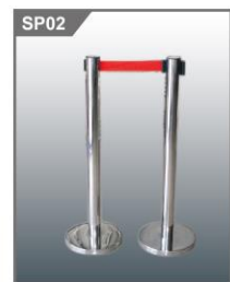
围栏 Barricade For Queue 1200H mm