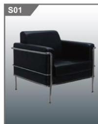
单人沙发 Single Sofa 700W x 700D x 455H mm