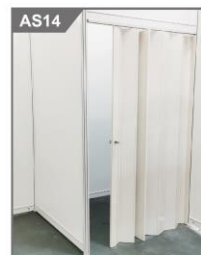
折门 Folding Door 950W x 2000H mm