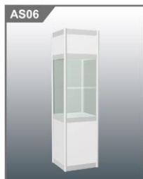
高身玻璃柜 Tall Glass Showcase 500L x 500W x 2000H mm