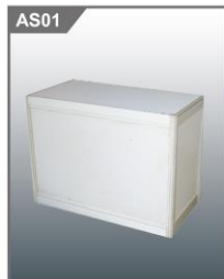
咨询桌 Information Counter 1000L x 500W x 750H mm