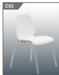
葫芦椅 Glisso 480W x 550mm x 800H mm