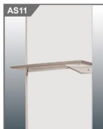
平层板 Flat Shelf 1000L x 300W mm