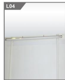
40W日光灯 40W Fluorescent Tube