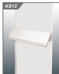
斜层板 Sloped Shelf 1000L x 300W mm