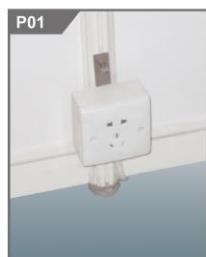
插座 Power Socket(Square Pin) Max.500W