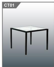
单人咖啡台 Coffee Table 550L x 550W x 450H mm