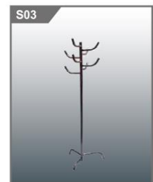
站立衣架 Coat Hanger 1710H mm