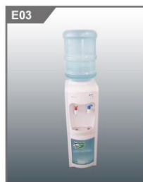
饮水机(配3桶水) Water Dispenser (3 buckets included)