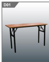
长条桌(无桌布) Long table w/o apron 1200L x 450W x 750H mm