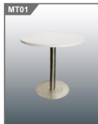
白色圆桌 Round Table 800Φ x 750H mm