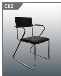
皮椅 Black Leather Arm Chair 570W x 440D x 455H mm